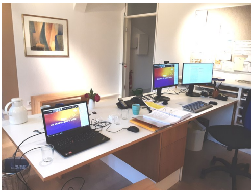
Sr. Reinhilds Arbeitsplatz während der digitalen EKD-Synode

Ein neuer Liederordner ist entstanden, und die Arbeit an unserer Ordensregel ist weiter fortgeschritten. Wir konnten an Konferenzen, Kursen, Fortbildungen und Synoden per Video teilnehmen und haben natürlich viel Zeit mit geistlicher Begleitung per Telefon oder per Skype verbracht.