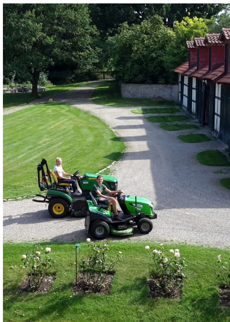
Im Garten halfen auch unsere Nachbarn mit